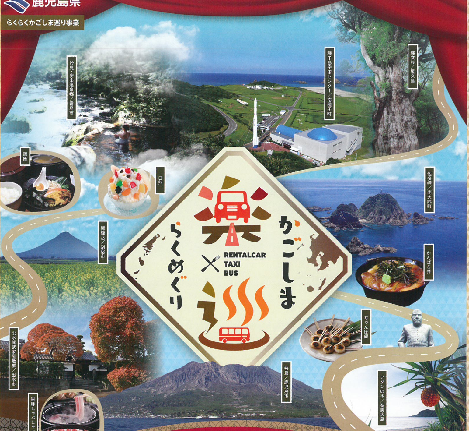
妙見・安楽温泉郷／霧島市